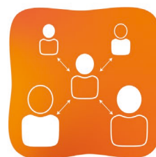
Vigilance pour tout rassemblement autorisé

Face au Covid-19 restons solidaires, bienveillants et attentifs les uns aux autres !