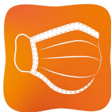
Port du masque