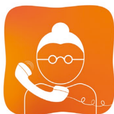
Protection des plus vulnérables