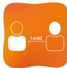
Respect des distances