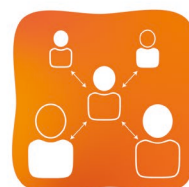
Vigilance pour tout rassemblement autorisé

En cas de contact à risque ou de symptômes: faites-vous tester et restez en quarantaine!