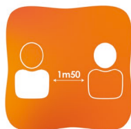
Respect des distances