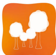
Activités à l'extérieur