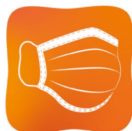
Port du masque