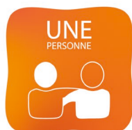
Limitation des contacts rapprochés